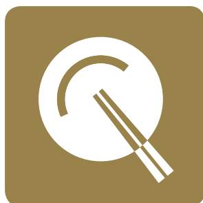
取り皿でのご提供