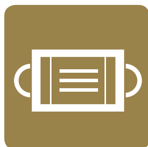
従業員のマスク着用