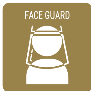
従業員の フェイスガード着用