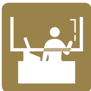
レジ等に パーティション設置