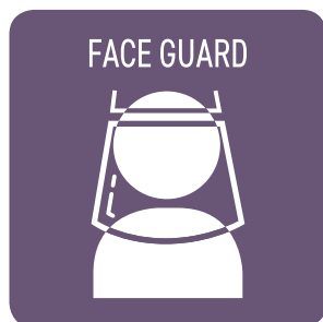
従業員の フェイスガード着用