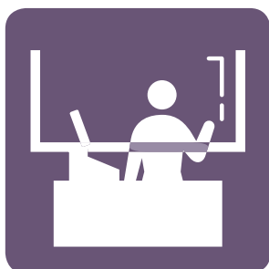
レジ等に パーティション設置