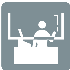
レジ等に パーティション設置