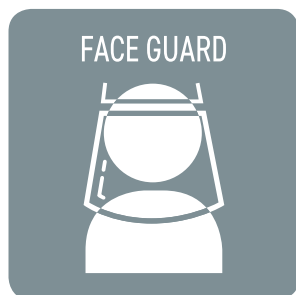
FACE GUARD 従業員の フェイスガード着用